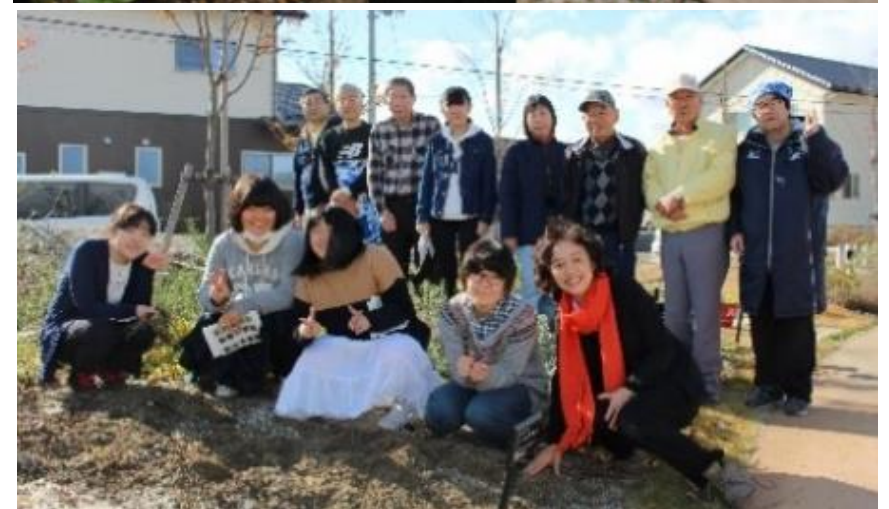
春に備えて、薬草園の管理を行いました。