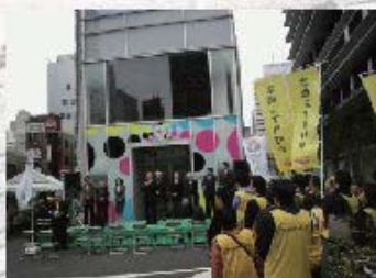
2013.3.30 「京橋大根河岸通り」 「京橋竹河岸通り」 命名式