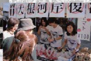
2012.10.21 日京祭 大根河岸復活