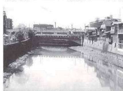
東京高速道路株式会社「東京高速道路三十年の歩み」