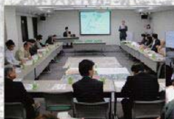
2012.10.15 NPO オープンセミナー