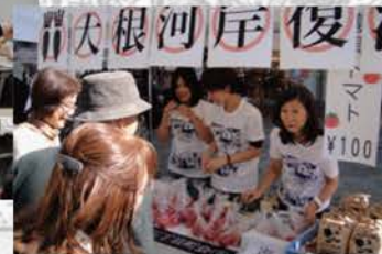
2012.10.21 日京祭 大根河岸復活