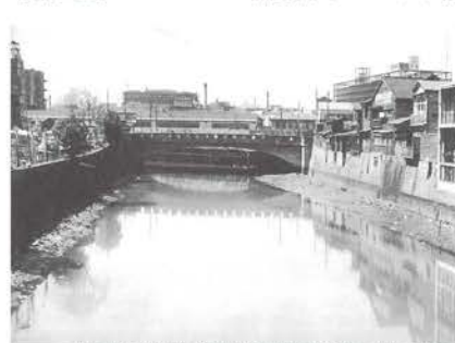
東京高速道路株式会社「東京高速道路三十年の歩み」