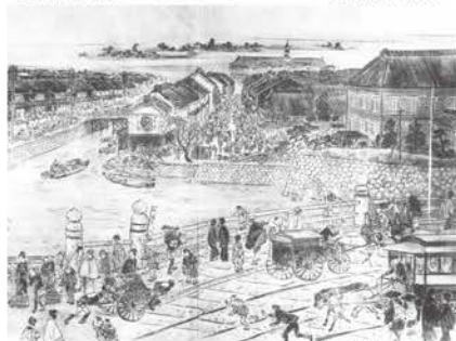
「新撰東京名所図会」