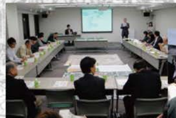
2012.10.15 NPO オープンセミナー