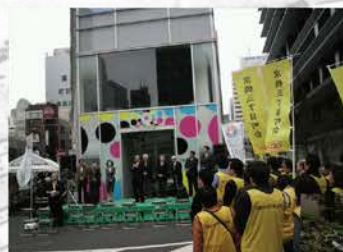
2013.3.30 「京橋大根河岸通り」 「京橋竹河岸通り」 命名式